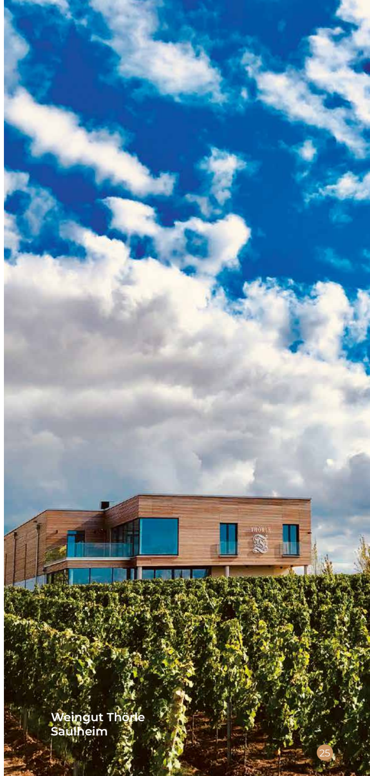
Weingut Thörle Saulheim

Untere Klinggasse 4 | 67595 Bechtheim Telefon 06242 2425 www.dreissigacker-wein.de > Nachhaltigkeit im Weintourismus