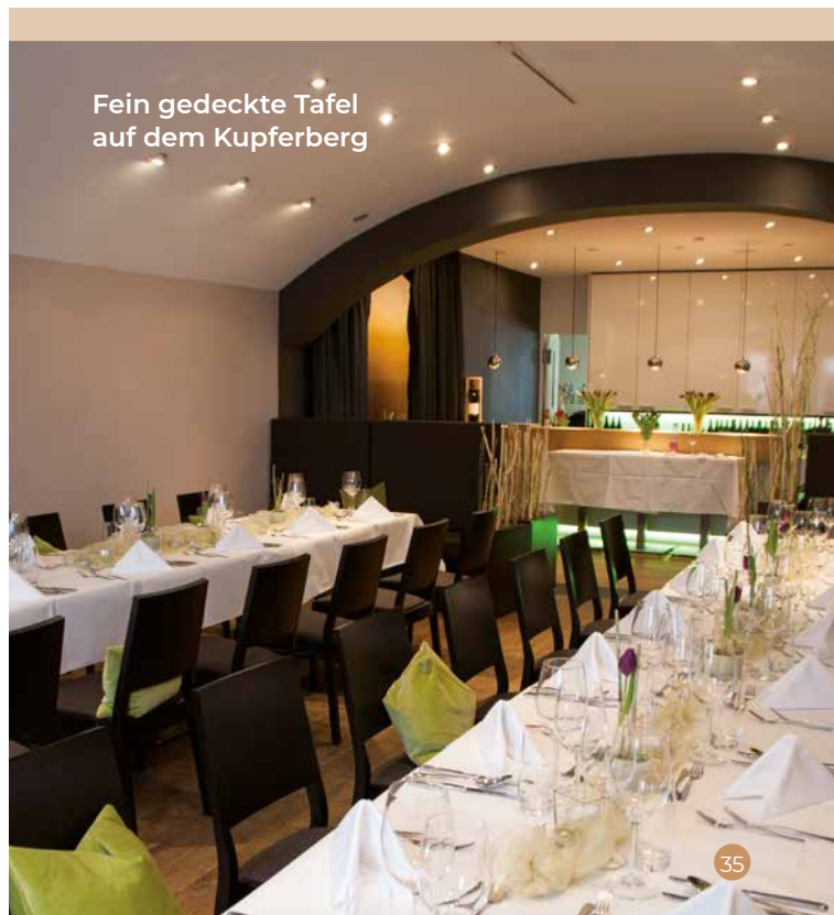
Fein gedeckte Tafel auf dem Kupferberg

Langgasse 41 | 55234 Flomborn Telefon 06735 960085 www.bernhardaeder.de > Nachhaltigkeit im Weintourismus