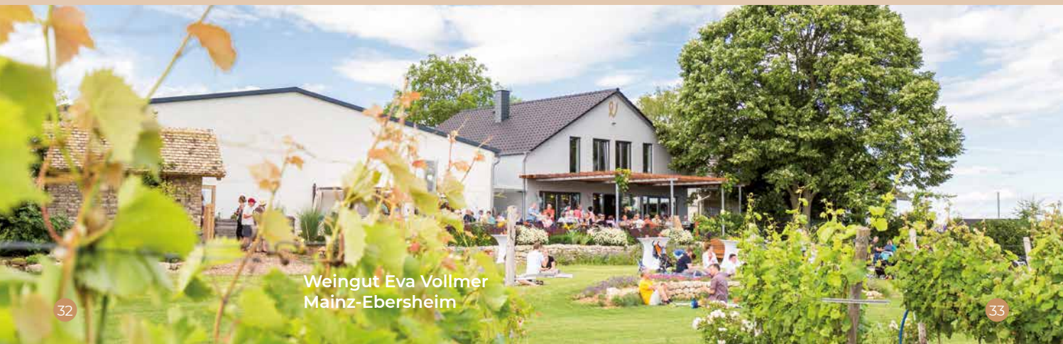
Weingut Eva Vollmer Mainz-Ebersheim

Hundertguldenmühle/Mühle 2 | 55437 Appenheim Telefon 06725 9990210 www.100guldenmuehle.de > Nachhaltigkeit im Weintourismus