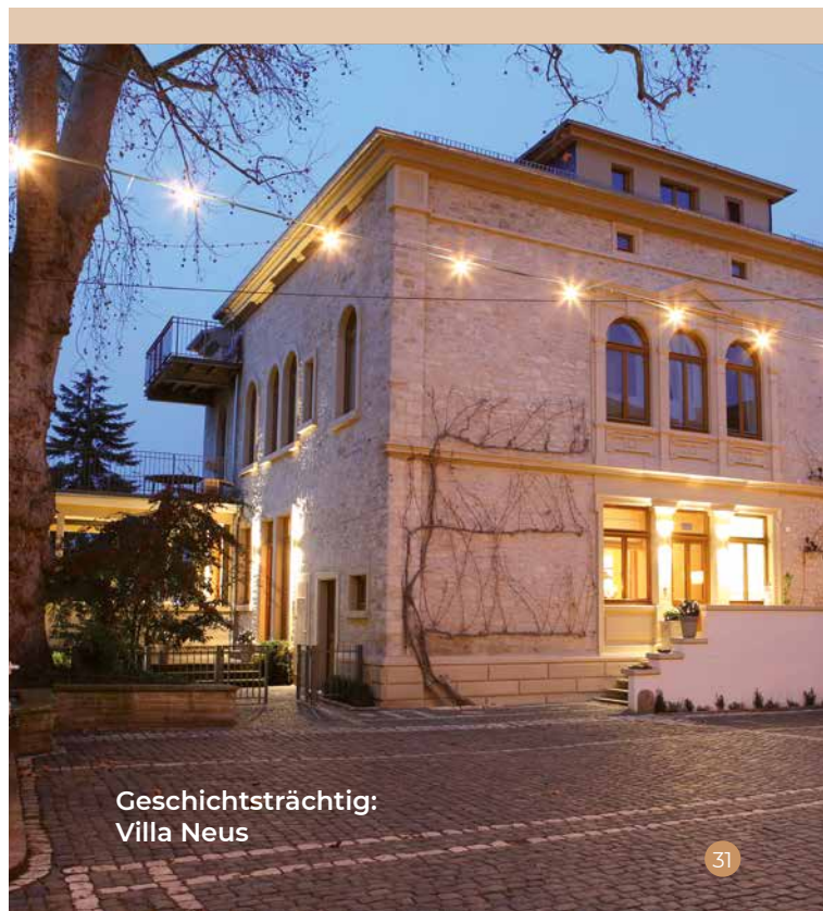
Geschichtsträchtig: Villa Neus

Hauptstraße 38 | 67591 Wachenheim Telefon 06243 8610 www.westwind-weine.de > Nachhaltigkeit im Weintourismus