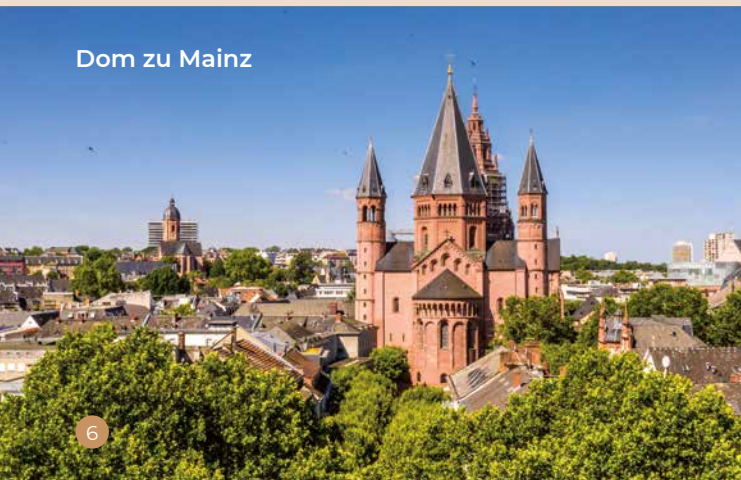
Dom zu Mainz

Die Great Wine Capital „Mainz und Rheinhessen“ ist die deutsche Vertretung des Netzwerks. Sie arbeitet daran, Rheinhessen und seine Weine im globalen Wettbewerb noch besser zu positionieren und mit dem angeschlossenen Netzwerk professioneller Reisebüros Stadt und Region als Reiseziel international bekannter zu machen.