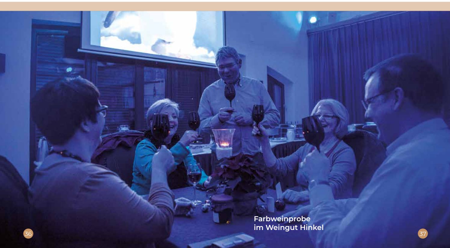
Farbweinprobe im Weingut Hinkel

Alle Preisträger:innen von 2009 bis 2025 finden Sie unter www.mainz.de/bestof